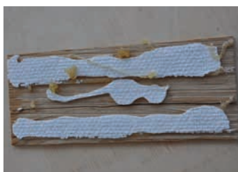
Essai d'adhérence sur un échantillon Wall