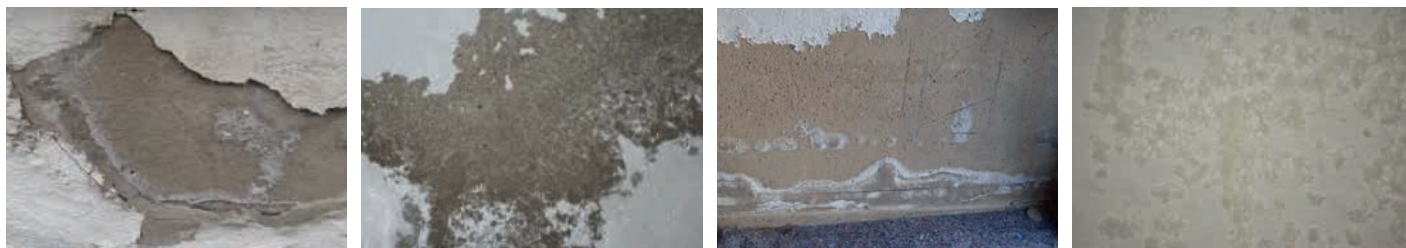
Exemples photo de surfaces murales non adaptées